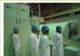
全国災害ボランティア議員連盟研修会 原子炉廃止措置研究開発センター（ふげん）調査