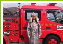
大津市消防出初式