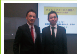
全国青年都道府県議会議員の会研修会 原発事故からの復興