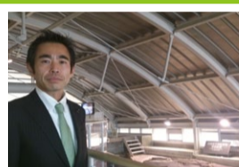
民主党近畿ブロック研修会 北淡震災記念公園調査