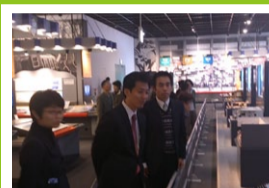
自治体青年政策ネットワーク研修会 人と未来防災センター調査