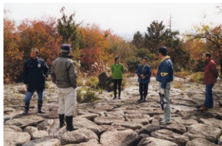
▲大津市大物 百間堤の現地調査

▶ 知事 外国資本による森林の土地取引における問題は、全国的・国際的な問題である。既に北海道、群馬県、埼玉県では制定済み。今年度中に条例提出を予定しているのは山形、茨城、福井、山梨、長野などがあり、こういうところの状態などをお伺いしながら研究して前向きに進めていきたい。