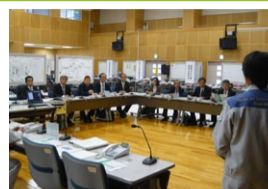
滋賀県議会 防災対策特別委員会 大飯原子力防災センター調査