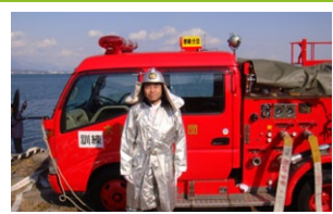
大津市消防出初式に参加