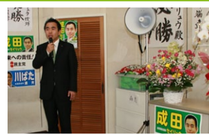
事務所を開設しました またお越しくささい