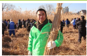
大津市民ヨシ刈りに参加