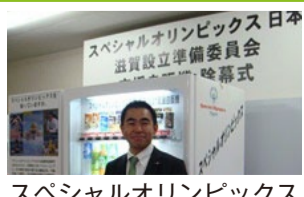
スペシャルオリンピックス 日本滋賀設立準備委員会 支援自販機除幕式